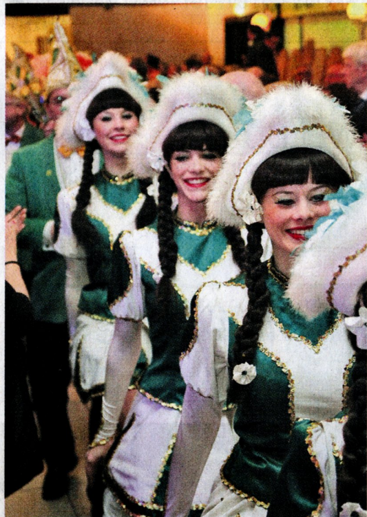
Machten beim Einmarsch und auf der Bühne eine gute Figur: die Brejpott-Tröpfchen.