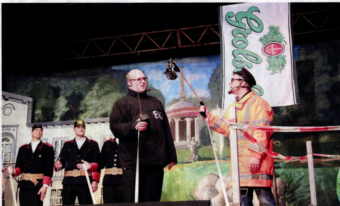
(Tret-)Minerfund beim Staatsbesuch im Museum Kurhaus: Die USK zeigte dem BKA wie einen Bombenentschärfung in Kleve abläuft.