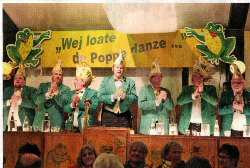
Beste Stimmung herrschte nicht nur auf der Bühne, sondern auch im Elferrat und im Saal. 400 Narren verfolgten die 1. Sitzung der Brejpott Quaker.