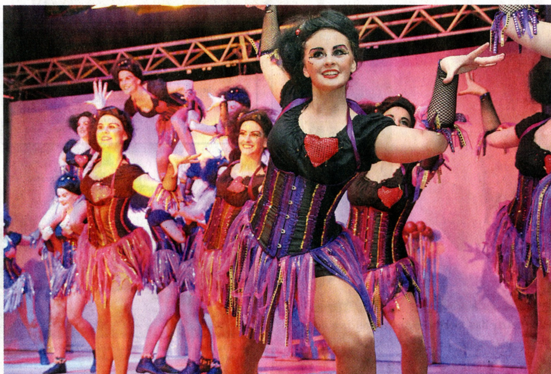
Die Brejpott-Tröpfchen präsentierten unter dem Titel „Voodoo Puppets“ einen schaurig-schönen Showtanz bei dem der Name Programm war.