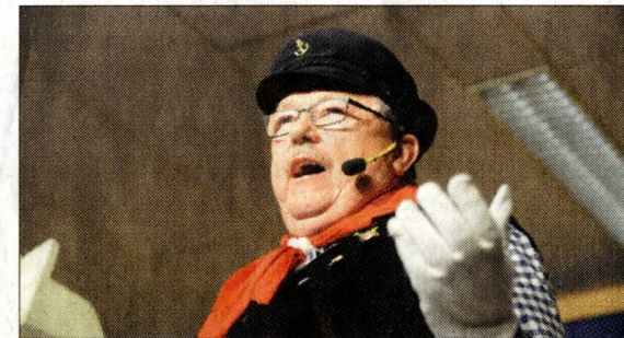
Die Büttenedner in Grieth hatten wieder Vieles zu erzählen.