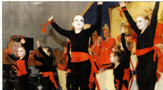
Die jungen Tänzerinnen wirbelten in Grieth über die Bühne des Bürgerhauses.

die Tanzgruppen, auch die Büttenedener gaben alles und durften sich über wohlverdienten Applaus freuen. Mit ihren phantasievollen Kostümen sorgten aber auch die Gäste für großes Hallo.