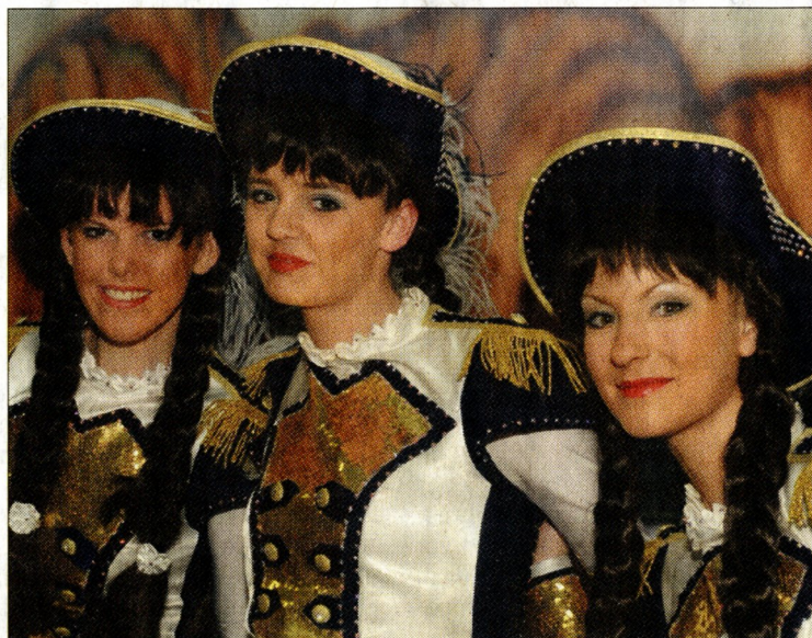
Ob Jung, ob Alt: Karneval ist in Bedburg-Hau ein As.