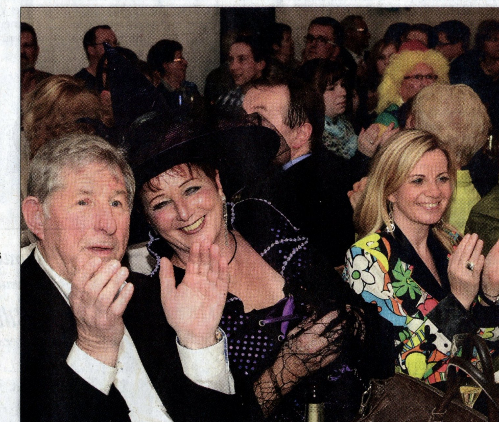
Das Publikum amüsierte sich prächtig im Kellener Schützenhaus. Längst sind auch die Kostümsitzungen am 15. und 22. Februar restlos ausverkauft.

Mehr Fotos unter lokal-kompas.de/ 396781