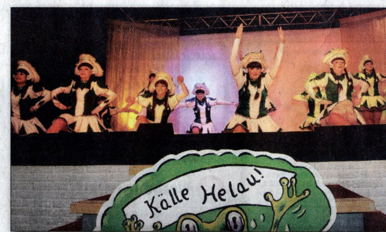
Die Brejpott-Tröpfchen mit ihrem Gardetanz.